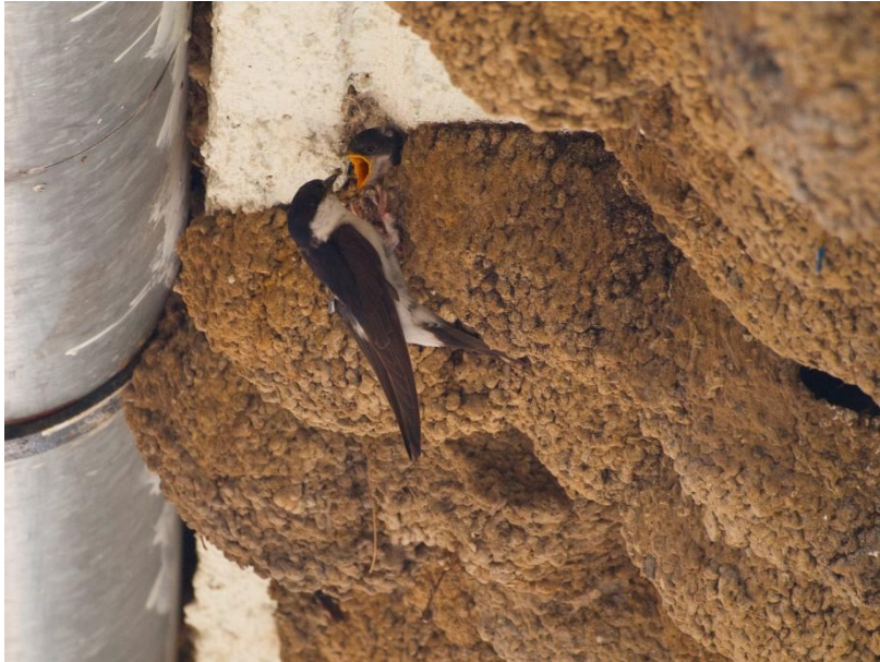
3. fotó. Molnár fecske geolokátorral