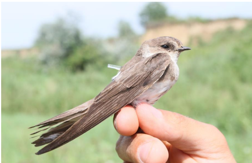
2. Partifecske a felhelyezett geolokátorral 2012-ben